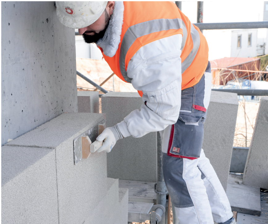
Die einfache Verarbeitung von swissporECORIT